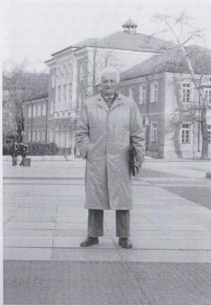
Четиридесет и четири години по-късно до Априловска гимназия, Габрово